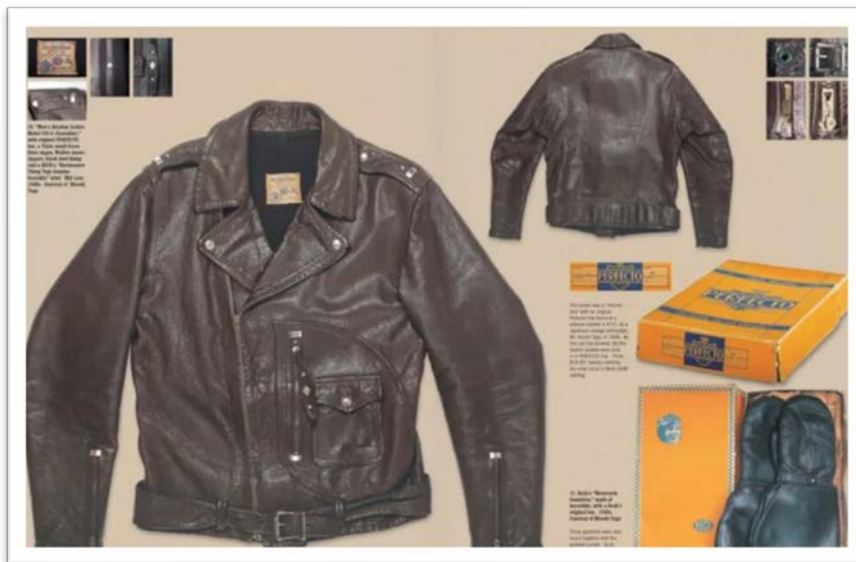
Рисунок 1. Куртка Perfecto

которую мы привыкли видеть и которая стала впоследствии классическим образцом курток косух и оставила значительное влияние на мир моды и стиля. Назвали куртку Perfecto в честь любимых сигар Шотта (рисунок 1) (отсюда и англоязычное название). Продали её всего за 5,50 долларов в магазине Harley Davidson в Нью-Йорке.